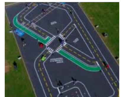
Схема организации дорожного движения