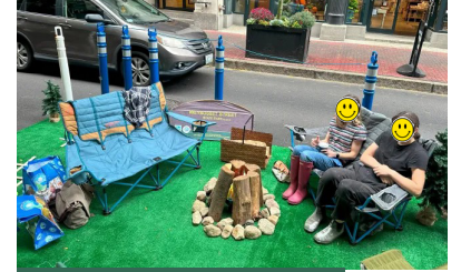
पार्किंग स्थान का विकल्प