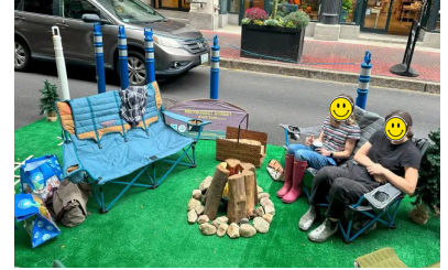
بديل لموقف السيارات

هل طالبك يمشي، أو يركب دراجة، أو يستقل الحافلة، أو يشارك ركوب السيارة مرة واحدة على الأقل خلال الأسبوع من 4 إلى 8 مايو 2026؟ نعم لا